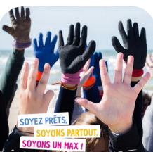
JOURNÉE MONDIALE DU NETTOYAGE DE NOTRE PLANÈTE

Contact : Centre Communal d'Action Sociale 12 Rue de l'Océan 44810 HERIC 02.40.57.96.10 ccas@heric.fr